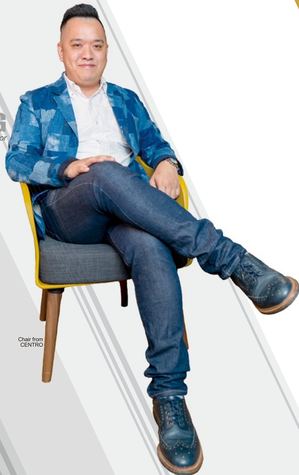
Chair from CENTRO