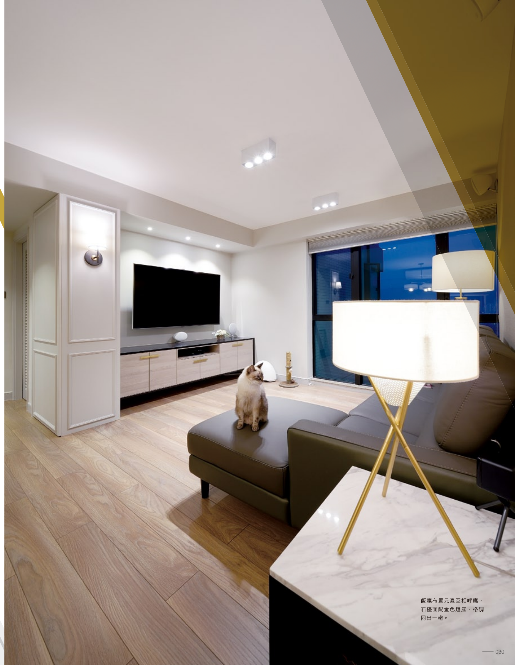
飯廳布置元素互相呼應， 石檯面配金色燈座，格調 同出一轍。

地址：香港九龍紅磡黃埔花園12期家居庭地下G44號舖 電話：2345 6773 電郵：info@boss-interiors.com.hk 網址：www.boss-interiors.com.hk